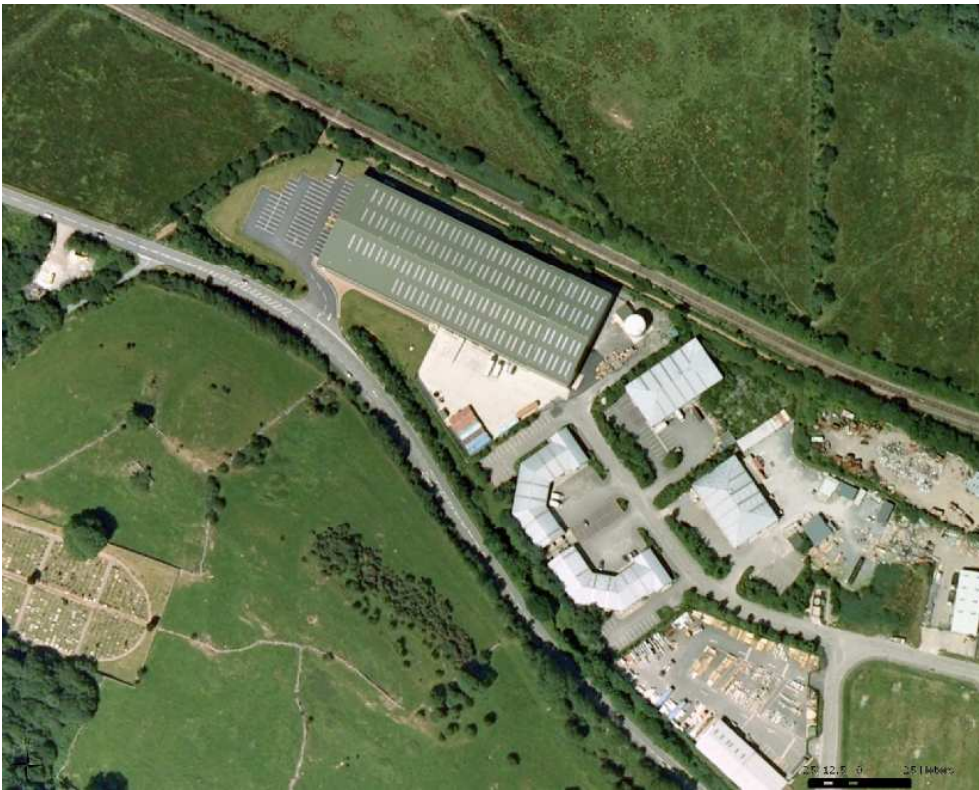
Lluniau awyr o'r safle cyn ac arol adeiladu'r warws.